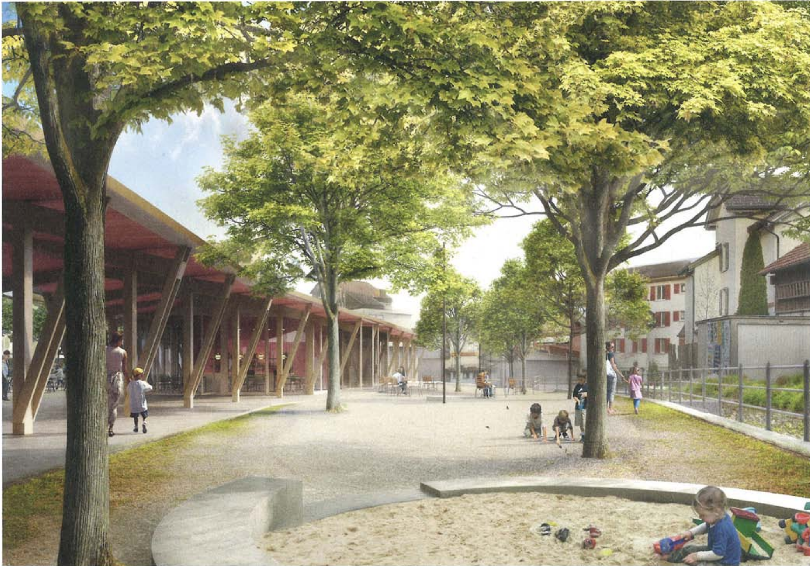
Bebautes Zentrum, Schmid Landschaftsarchitektur mit Esch Sintzel Architekten.

Z u den wichtigsten sehenswerten Baudenkmalern in Flawil zählen das Alte Rathaus, der Gasthof Hirschen sowie die evangelische und die katholische Kirche. Der Marktplatz gehört definitiv nicht dazu. Er wird als Autoabstellplatz und Entsorgungsstandort genutzt. Die viergeschossigen Gebäude der Migros im Westen und der Raiffeisenbank im Norden bestimmen die unmittelbare Umgebung. Die Bebauung entlang der Gupfengasse mit Stickerhäusern ist dagegen eher kleinmassstäblich. Um den Marktplatz aus seinem Dornröschenschlaf zu wecken, hat die Gemeinde verschiedene Rahmenbedingungen für eine neue Nutzung