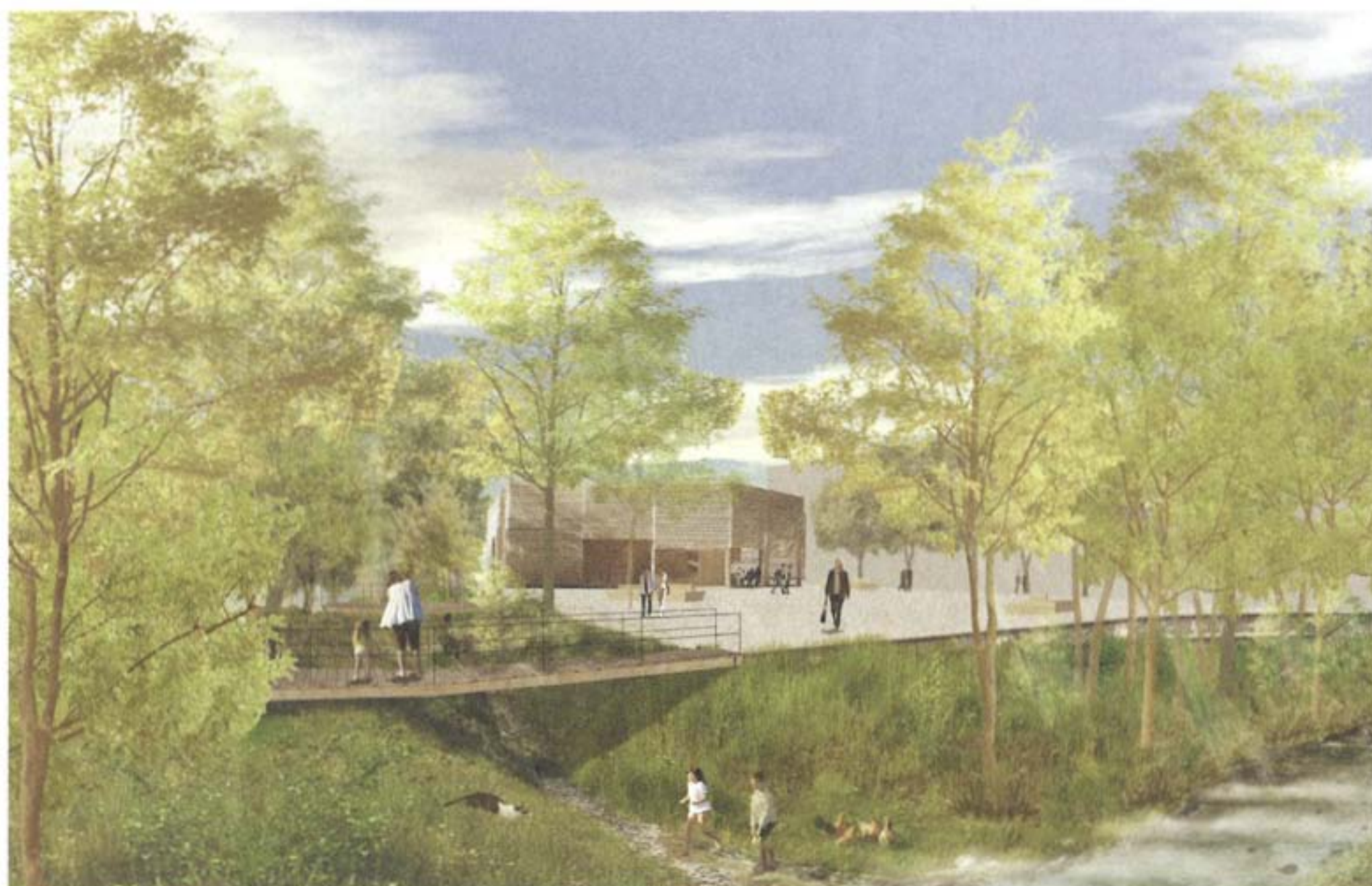
Leere Mitte: Mettler Landschaftsarchitektur und Geisser Streule Inhelder Architekten.

und der Platz ist doch klar gefasst. Zwei Fussgängerbrücken verbinden den Marktplatz mit den angrenzenden Dorfteilen. Konsequenterweise wird auf eine Bepflanzung der Tiefgarage mit Bäumen verzichtet. Die naturnahe Gestaltung der Gewässer kann aber angesichts der geringen Wassermengen, der beachtlichen Höhenunterschiede und der dafür erforderlichen aufwendigen baulichen Massnahmen nicht überzeugen.