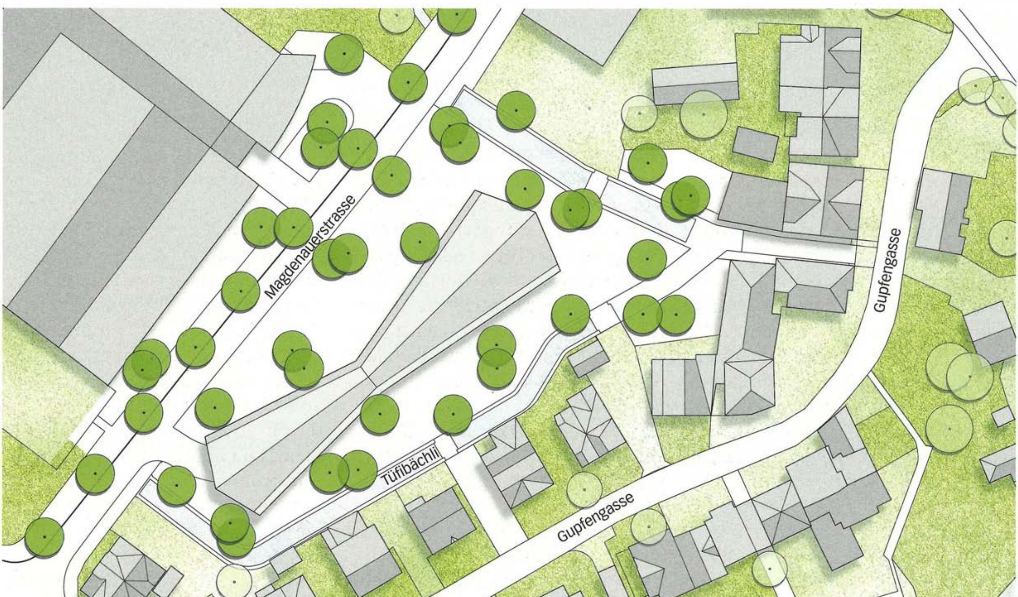
Grosses Dach, Baumhain und kanalisierte Bäche , Schmid Landschaftsarchitektur mit Esch Sintzel Architekten. Mst. 1:1000.

Einen anderen Ansatz verfolgen Mettler Landschaftsarchitektur und Geisser Streule Inhelder Architekten. Ihr grosses Thema ist die Offenlegung der Bäche. Sie gestalten die Bachböschungen naturnah und bepflanzen sie locker mit einheimischen Baumarten. So bleiben Durchblicke zum angrenzenden Quartier,